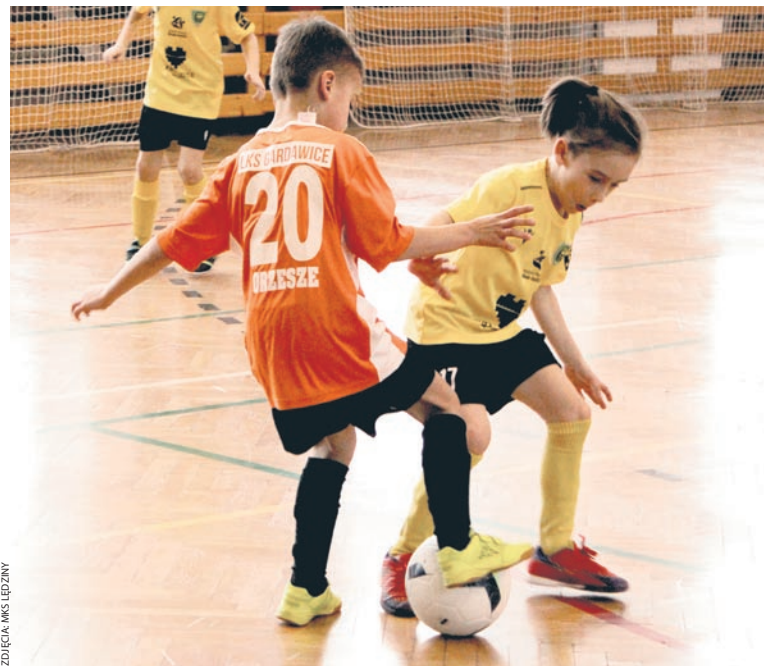
ZDJĘCIA: MKS ŁĘDZINY