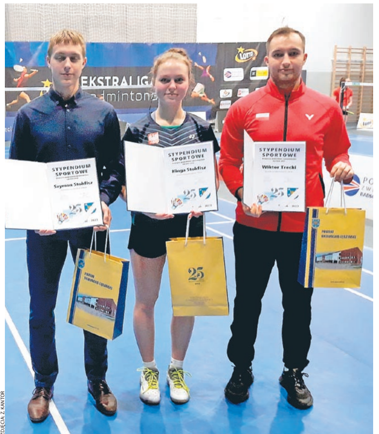
ZDJĘCIA: Z KANTOR