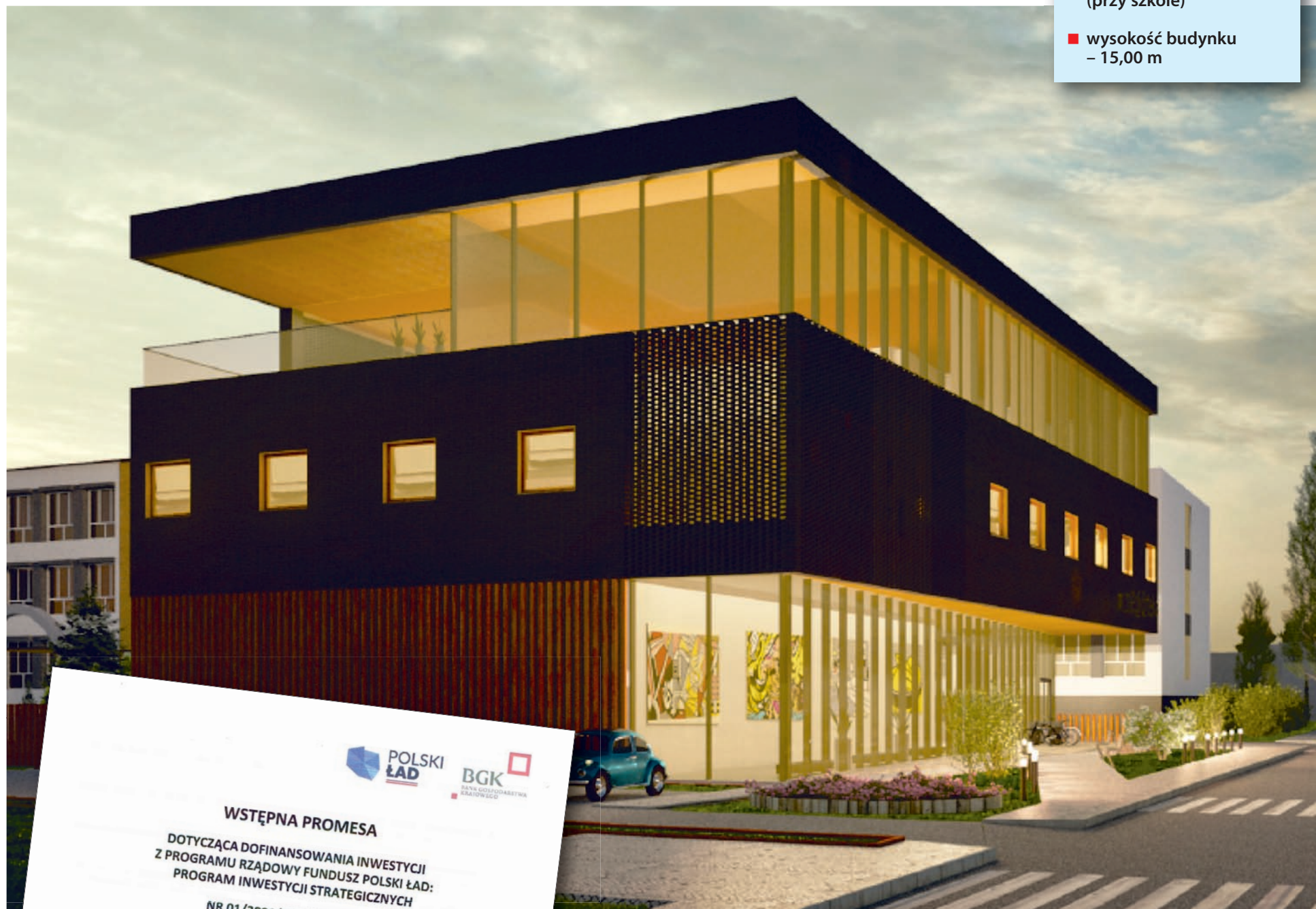
Wizualizacja: Studio Projektowe Jakub Gajek

WSTĘPNA PROMESA DOTYCZĄCA DOFINANSOWANIA INWESTYCJI Z PROGRAMU RZĄDOWY FUNDUSZ POLSKI ŁĄD: PROGRAM INWESTYCJI STRATEGICZNYCH NR 01/2021/3606/PolskiŁad