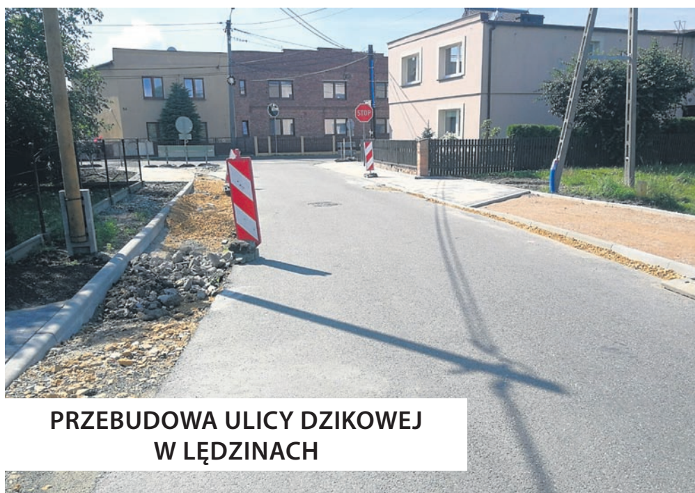
PRZEBUDOWA ULICY DZIKOWEJ W ŁĘDZINACH

nanie kanalizacji deszczowej i oświetlenia oraz budowę, przebudowę i likwidację części rowów, prace dobiegają końca. Koszt jego realizacji zamknie się kwotą 2 296 813,38 zł . Zadanie realizowane jest przez JKM Sp. z o.o. z Mikołowa.