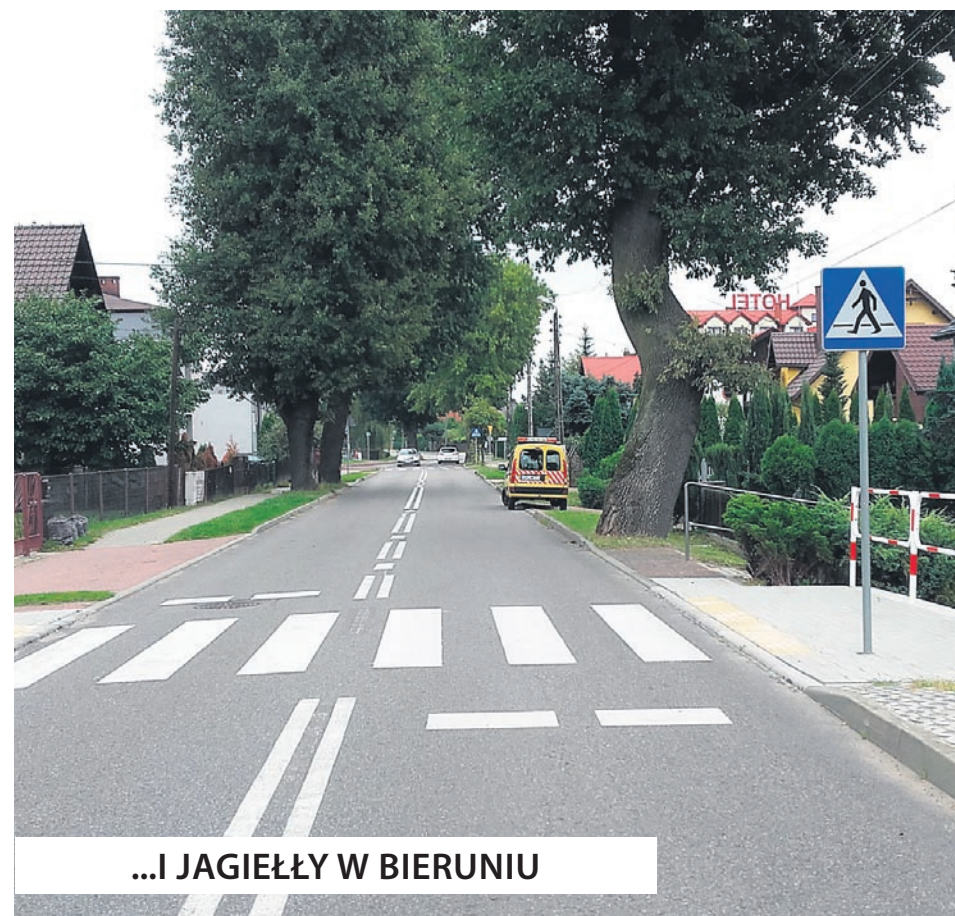
...I JAGIEŁŁY W BIERUNIU

Również z końcem czerwca PZD w Bieruniu sfinalizował zadanie Przebudowa drogi powiatowej 4137S, ul. Bijasowickiej i ul. Jagiełły w Bieruniu w zakresie wykonania odcinkowych ciągów pieszych dla poprawy bezpieczeństwa ruchu drogowego, które polegało na budowie odcinkowych ciągów pieszych oraz przejść dla pieszych w pasie drogowym ulicy Bijasowickiej (przy mini-arboretum) oraz ulicy