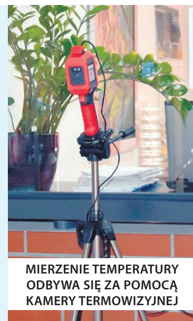
MIERZENIE TEMPERATURY ODBYWA SIĘ ZA POMOCĄ KAMERY TERMOWIZYJNEJ

W trosce o zapewnienie należytej ochrony wszystkich osób wchodzących i przemieszczających się po budynku Starostwa Powiatowego w Bieruniu i jego jednostkach organizacyjnych, przed zakażeniem się wirusem SARS-Co V-2, tak by poprzez obecność w zakładzie nie doszło do narażenia ich życia i zdrowia, Śląski Państwowy Wojewódzki Inspektor Sanitarny nakazał objęcie codziennym pomiarem temperatury ciała wszystkie osoby wchodzące na teren Starostwa w Bieruniu (ul. Św. Kingi 1) i jego jednostek organizacyjnych tj: Liceum Ogólnokształcącego w Bieruniu (ul. Licealna 17), Powiatowego Zespołu Szkół w Bieruniu (ul. Granitowa 130), Powiatowego Zespołu Szkół w Łędzinach (ul. Pokoju 4), Poradni Psychologiczno-Pedagogicznej w Bieruniu (ul. Granitowa 130), Poradni Psychologiczno-Pedagogicznej w Bieruniu Filia w Łędzinach (ul. Łędzińska 24), Powiatowego Centrum Pomocy w Rodzinie w Łędzinach (ul. Łędzińska 24), Centrum Usług Społecznych w Łędzinach (ul. Łędzińska 24a), Powiatowego Zarządu Dróg w Bieruniu (ul. Warszawska 168).