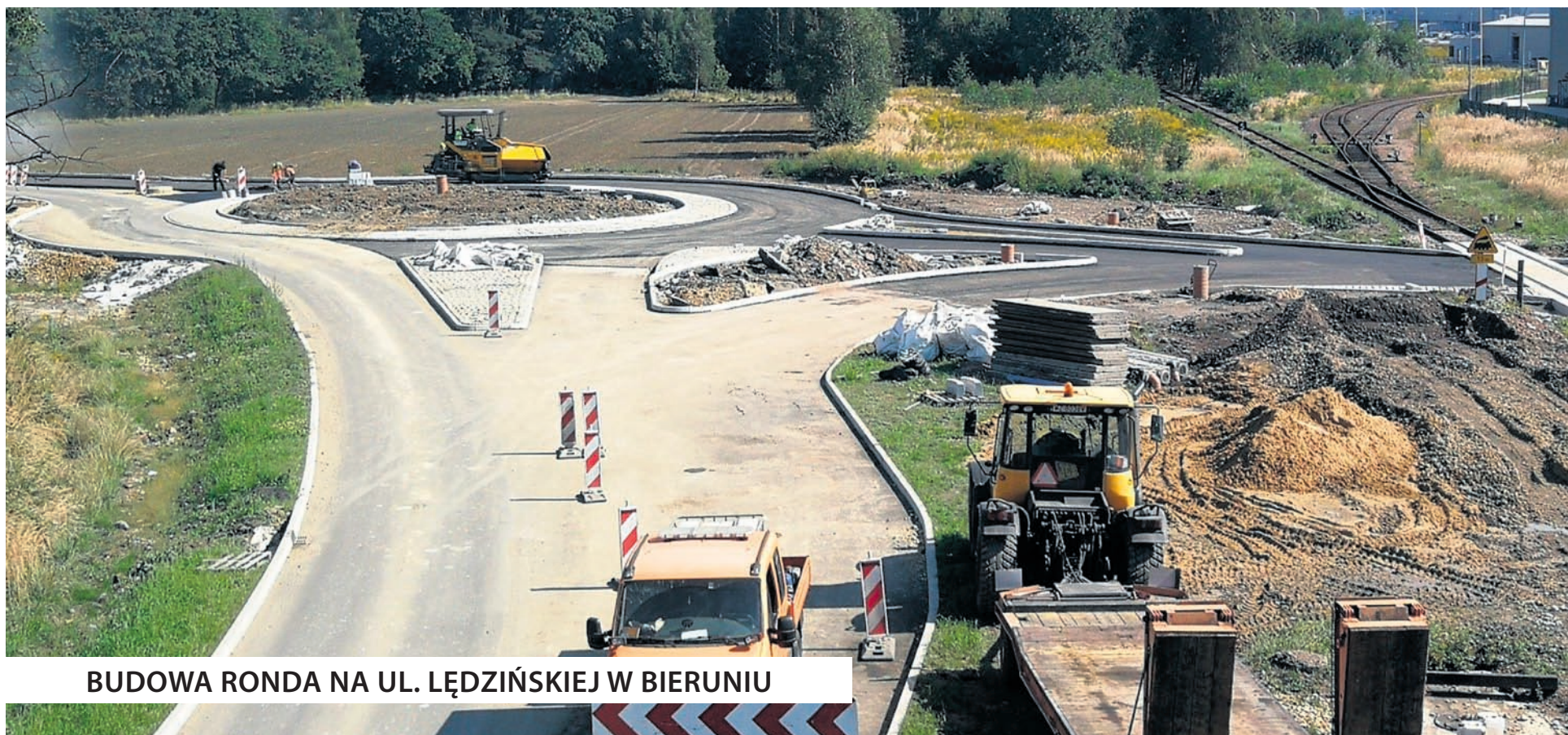
BUDOWA RONDA NA UL. ŁĘDZIŃSKIEJ W BIERUNIU

KONTYNUOWANE SĄ DWIE WAŻNE POWIATOWE INWESTYCJE DROGOWE. POWIATOWY ZARZĄD DRÓG W BIERUNIU DO 30 PAŹDZIERNIKA BR. PLANUJE ZAKOŃCZYĆ ROBOTY BUDOWLANE PRZY RONDZIE NA ULICY ŁĘDZIŃSKIEJ W BIERUNIU ORAZ PRZEBUDOWĘ ULICY DZIKOWEJ W ŁĘDZINACH.