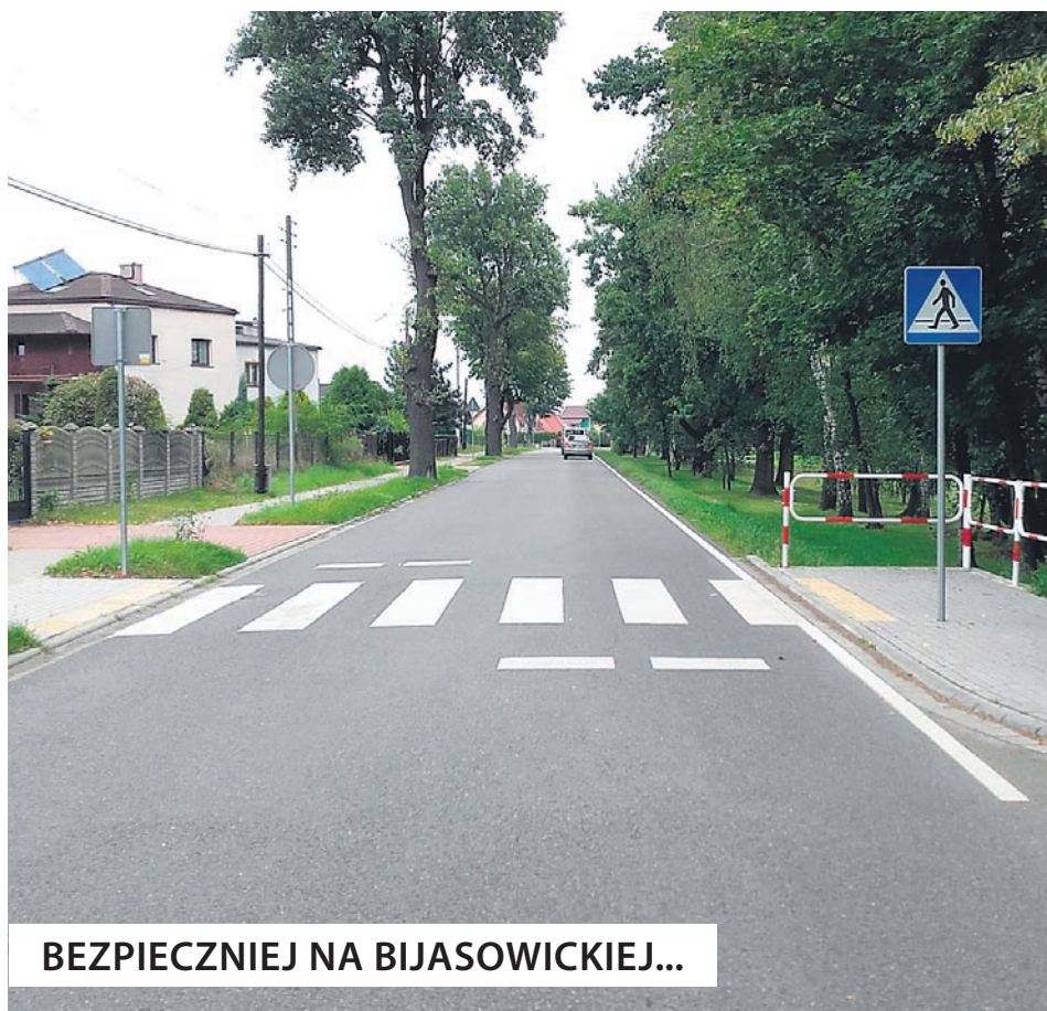
BEZPIECZNIEJ NA BIJASOWICKIEJ...

gości 773 m, przebudowie pobocza po lewej stronie na chodnik o szerokości 2,0 m i długości 773 m, przebudowie i przebrukowaniu po obu stronach jezdni zjazdów indywidualnych, zlokalizowanych w pasie drogowym oraz wykonaniu odwodnienia – kanalizacji deszczowej. Wartość prac, wykonanych przez bojszowską spółkę INFRA X to 2 223 220,62 zł.